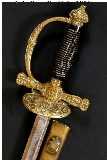
ESPADAS DE CEÑIR Oficial Guardia Civil modelo 1844 Libro ESPADAS ESPAÑOLAS, por Vicente Toledo