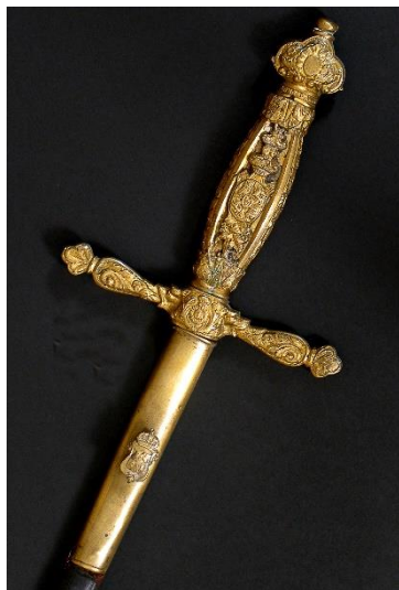
ESPADA DE CEÑIR Para oficial de Intendencia modelo 1911 Libro ESPADAS ESPAÑOLAS, por Vicente Toledo