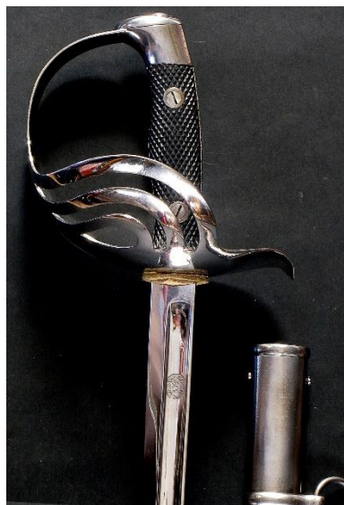
ESPADA DE MONTAR Jefes y oficiales del Escuadrón de la Escolta Real modelo 1910 Libro ESPADAS ESPAÑOLAS, por Vicente Toledo