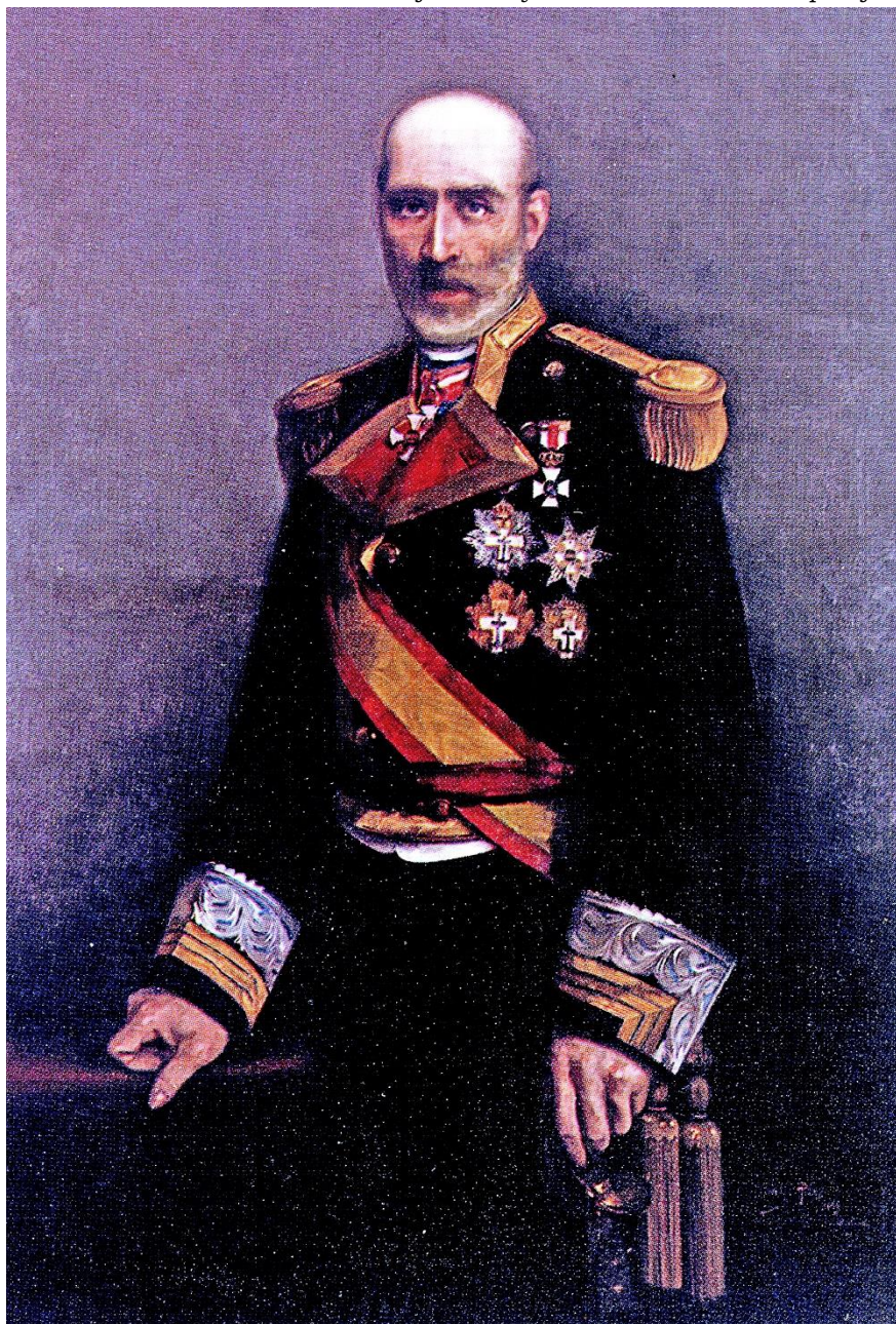
Óleo pintado por Cecilio Pla, Madrid 1889. Museo Naval de Madrid nº inv. 5634