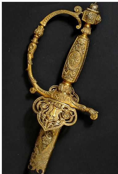
ESPADA DE CEÑIR Oficial Ingenieros de la Armada hacia 1870 Libro ESPADAS ESPAÑOLAS, por Vicente Toledo