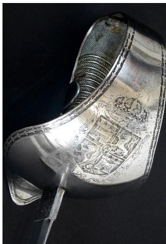
SABLE Para oficial de Caballería, modelo 1878 Libro ESPADAS ESPAÑOLAS, por Vicente Toledo