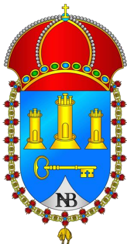
Escudo de La Habana

Del tahalí pende un machete modelo 1881. Guarnición de hierro, gavilanes rectos vueltos en sentido contrario, puño de madera cuadrillada sujeta por dos pasadores. Hoja con doble curvatura y vaina de cuero con aparejos de hierro.