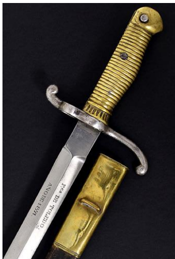
ESPAÑA BAYONETA Guardia Amadeo I modelo 1871

Libro ESPADAS ESPAÑOLAS, por Vicente Toledo