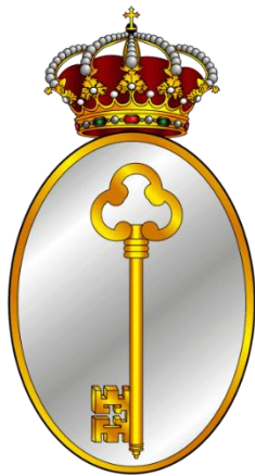
Emblema Regimiento de Infantería de Línea, San Fernando nº 11

Sable modelo 1851 para jefes y oficiales de Infantería. Guarnición dorada, con un gavilán y cazoleta con el escudo de España, puño forrado con piel de lija y alambrado con torzal de hilo de cobre. Hoja ligeramente curva y la vaina metálica con dos abracaderas y sus correspondientes anillas.