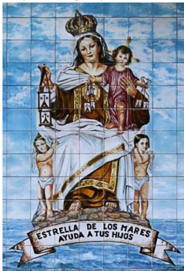
Virgen del Carmen, patrona de los navegantes y desde 1901 de la Armada Española

En la mano derecha, un fusil con su correspondiente bayoneta de cubo cuya vaina pende del cinto, y en el lado izquierdo, un cuchillo de abordaje para la Armada modelo 1861. Guarnición de latón dorado formada por puño con gallones y cruz de gavilanes rectos. Hoja con doble curvatura y vaina de cuero negro con aparejos de latón dorado.