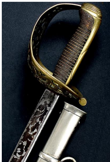
SABLE Oficial Caballería Ligera modelo 1840 Libro ESPADAS ESPAÑOLAS, por Vicente Toledo