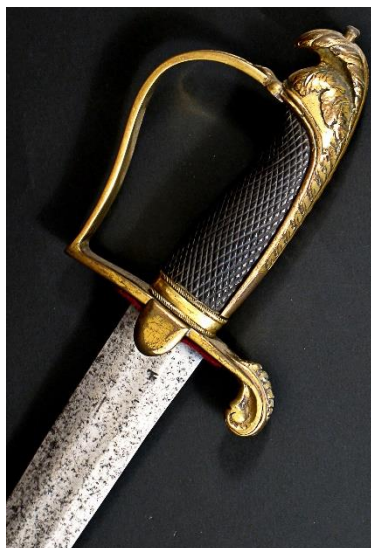
SABLE Para oficiales hacia 1800 Libro ESPADAS ESPAÑOLAS, por Vicente Toledo