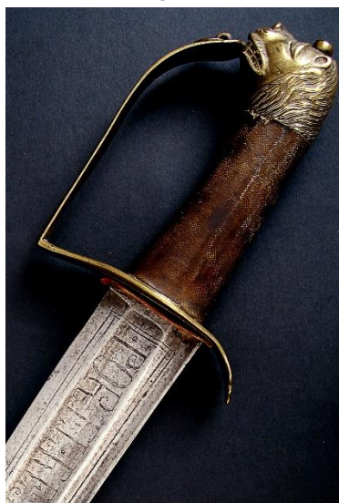
SABLE ABORDAJE Armada Española siglo XVIII Libro ESPADAS ESPAÑOLAS, por Vicente Toledo