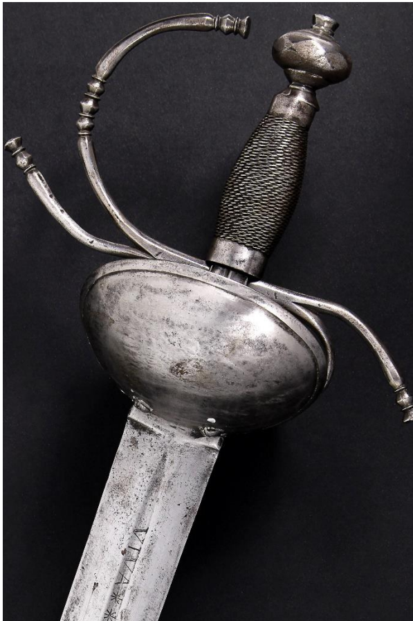
INSCRIPCIÓN: VIVA EL REY DE ESPAÑA

Como podemos ver, tanto en esta ficha como en la anterior, se realizaron muchas variantes de esta espada llamada de "boca de caballo". también en las hojas, las inscripciones o lemas que apreciamos pueden ser muy variadas como es el caso de estas dos espadas dedicada al rey.