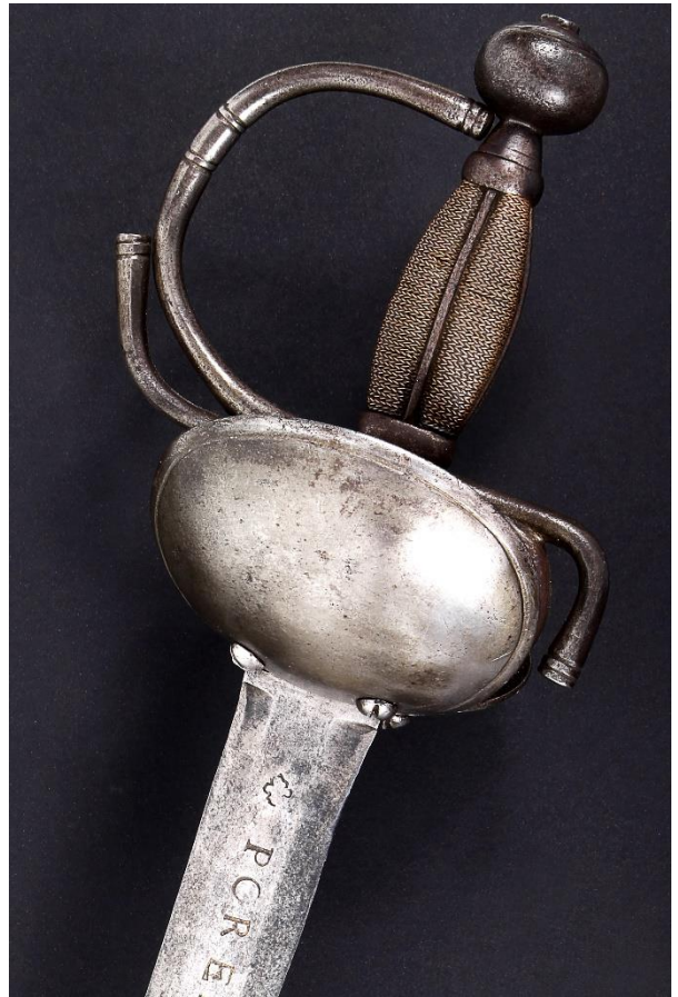
INSCRIPCIÓN: POR EL REY CARLOS III / CABALLERIA