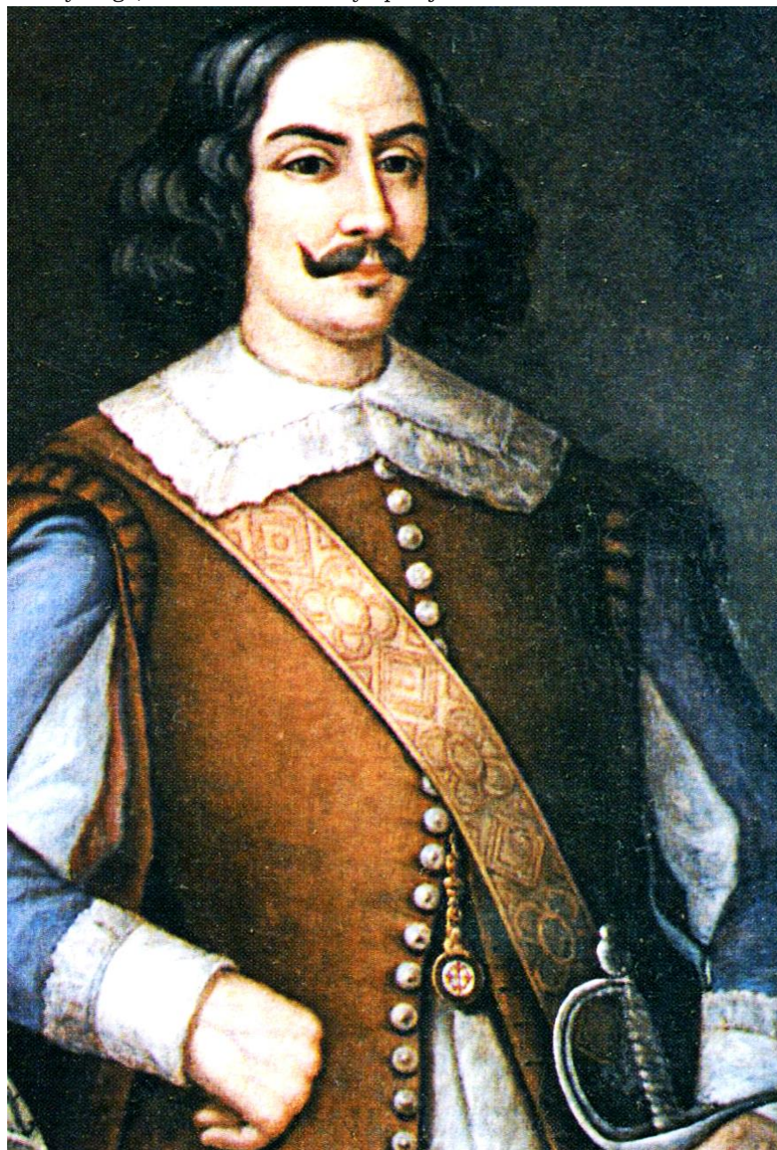
Óleo anónimo español del siglo XX. Archivo-Museo D. Álvaro de Bazán nº inv. 4820