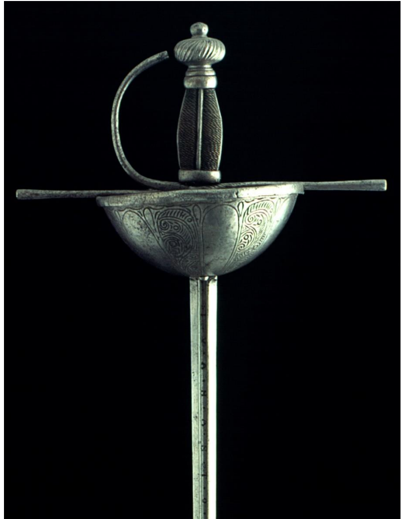
Long T: 1170 Hoja: 990 Ancho hoja: 020