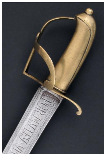
SABLE Libro ESPADAS ESPAÑOLAS, MILITARES Y CIVILES. APÉNDICE Pág. 257-G