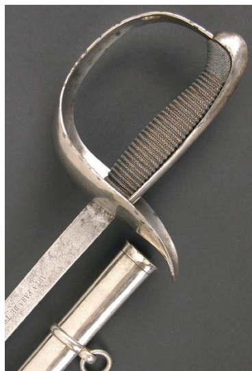
SABLE Jefes y oficiales de Infantería modelo 1887 Libro ESPADAS ESPAÑOLAS, MILITARES Y CIVILES. Pág. 339